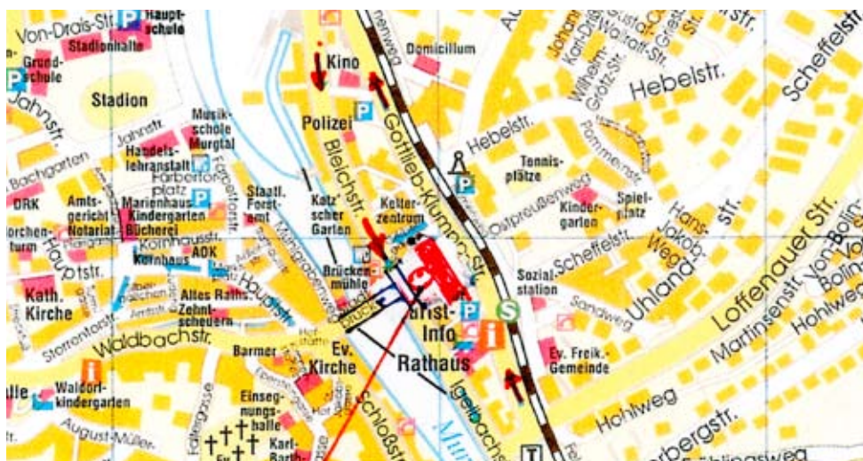
Neu Innenstadt Mitte mit Salmenplatz Verkehrskonzept nach Variante 1 optimiert