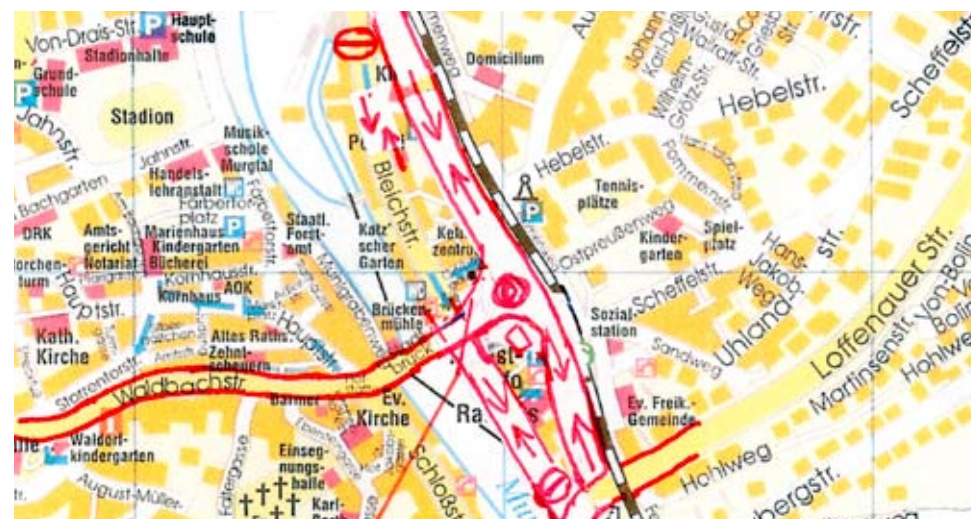
Die Salmengasse als „Schnellstraße“ Verkehrskonzept nach Variante 2.0